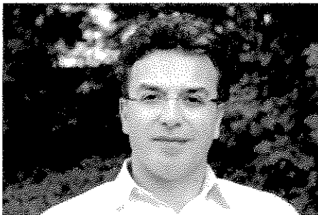
Memet Kilic, Vorsitzender des Bundesausländerbeirats

Der Bundesausländerbeirat fordert das kommunale Wahlrecht für alle Ausländer in Deutschland. Diese Forderung steht auf einer Liste von rechtlichen und finanziellen Verbesserungsvorschlägen, welche das Gremium am Sonntag in München verabschiedete, an erster Stelle. Bislang sind nur Ausländer aus EU-Staaten zu Wahlen in den Städten und Gemeinden zugelassen - und selbst das ist oftmals nicht im Sinne dessen, was dafür als Vorwand herhalten muss, nämlich Integration: In verschiedenen mitteldeutschen Gemeinden werden zu den nächsten Kommunalwahlen Ableger diverser polnischer Parteien antreten.